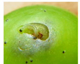
Perforation d'où sort une larve de cochylis

Ceci confirme la justesse des comptages de pontes effectués ces dernières semaines.