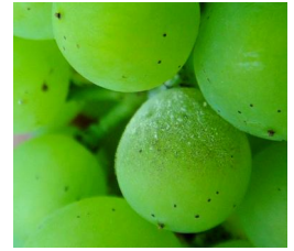
Oïdium : feutrage sur baie

Concernant la gestion de l'oïdium en fin de campagne, la règle de décision reste la même que les années précédentes : un bilan sanitaire doit être réalisé dans chaque parcelle en fin de persistance d'application effectuée au stade fermeture, soit 10 à 21 jours après ce stade selon la nature du fongicide utilisé. Ce comptage effectué sur 100 grappes (20 ceps x 5 grappes) permet de juger du niveau d'attaque de l'oïdium sur grappes et de définir la conduite à tenir :