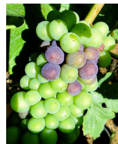
Début véraison sur Pinot Noir

Dans les parcelles les plus tardives, le stade fermeture de grappe est atteint. La précocité semble à l'heure actuelle toujours très proche de 2003 et 2007 et ce point va se préciser à partir du moment où la véraison va réellement s'enclencher.