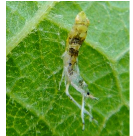
Eclosion d'une Cicadelle FD adulte

Pour plus d'informations sur les maladies et ravageurs, nous vous invitons à vous reporter au guide de la viticulture durable de Bourgogne accessible sur :