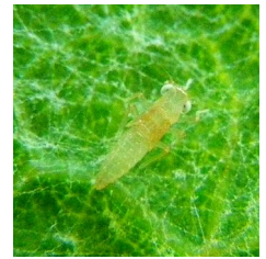
Larve de Cicadelle Verte

Les éclosions de larves de cicadelle verte de 2 ème génération sont en cours. Les niveaux de population demeurent faibles et la valeur maximale ne dépasse pas pour l'instant 20 larves pour 100 feuilles. On se situe encore loin du seuil d'intervention fixé à 100 larves pour 100 feuilles (seuil de nuisibilité plus élevé).