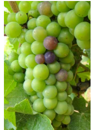
Début véraison sur Pinot Noir

Cette météo défavorable réduit quelque peu l'avance acquise jusqu'à maintenant et 2011 s'éloigne de 2003 pour se rapprocher de 2007.