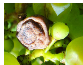
Black-rot sur baie, avec présence de pycnides

A partir de fermeture de grappe, le risque de contaminations sur grappes décroît progressivement pour devenir quasiment nul à partir de début véraison.