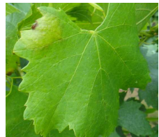
Tache de mildiou

On ne note pratiquement pas d'évolution par rapport à la situation décrite la semaine dernière : la quasi-totalité des parcelles du vignoble apparaît très saine. Dans de très rares situations, une sortie de taches sur jeunes feuilles a pu être notée suite aux pluies des 07 au 10 juillet.